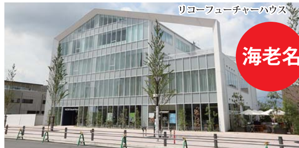
リコーフューチャーハウス