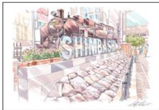
新橋SL広場と高輪築堤の石垣

日比谷通りの伝染病研究所門前「ワビ」の跡にこの碑が建っています。1892年(明治25年)にドイツ留学から帰国した北里柴三郎が、細菌学者の交流を契機として伝染病研究所を開設しました。