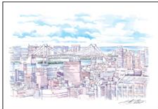
東京タワーからお台場エリアを臨む

ドワマのシーンでもたびたび登場するスポットとして有名な「芝公園4号地」。東京タワーを撮影できるスポットとして、キレイでまっすぐに続く一帯の先に東京タワーがある背景はこの「芝公園の4号地」だけで1階対称に並ぶ照明の先にもびくも、ライトアップした東京タワーの定番ポイントです。