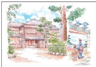
東京タワー 芝公園4号地から

東京でも目録の観光スポットが数多く「お台場」。お台場は、東京湾ウォーターフロントの中心に位置し、都心からのアクセスも抜群です。東京タワーから臨むお台場エリアは絶景スポットの一つです。