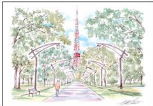
東京タワー 芝公園4号地から

ドワマのシーンでもたびたび登場するスポットとして有名な「芝公園4号地」。東京タワーを撮影できるスポットとして、キレイでまっすぐに続く一帯の先に東京タワーがある背景はこの「芝公園の4号地」だけで1階対称に並ぶ照明の先にもびくも、ライトアップした東京タワーの定番ポイントです。