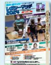
サッカーレガシーマッチ2024、イラスト展示の様子。

2024年3月2日(土)みなとパーク芝浦で行われた「障がい者レガシーマッチ2024」に、協力団体として百景イラストの展示を行いました。