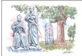
勝海舟と坂本龍馬の姉弟像

この地は、勝海舟が1872年(明治5年)から1899年(明治32年)に77歳で亡くなるまで27年間住んだ屋敷があった場所です。海舟は、明治維新後、旧幕府の代表者として新政府の要職に立ちまわっていました。坂本龍馬との縁は海舟が幕府の要職に任じられていた頃(海舟37歳～46歳)で、龍馬(26歳～31歳)は海舟を師と仰いで深い交際があったようです。