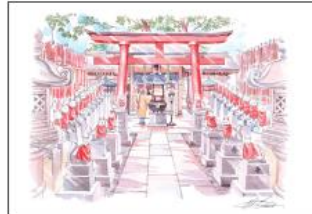
豊川稲荷神社 東京別院

この地は、勝海舟が1872年(明治5年)から1899年(明治32年)に77歳で亡くなるまで27年間住んだ屋敷があった場所です。海舟は、明治維新後、旧幕府の代表者として新政府の要職に立ちまわっていました。坂本龍馬との縁は海舟が幕府の要職に任じられていた頃(海舟37歳～46歳)で、龍馬(26歳～31歳)は海舟を師と仰いで深い交際があったようです。