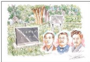
伝染病研究所発祥の地

芝公園4号地にある記念地。明治5年に芝公園の一角に設立された札幌高等学校の前身にあたります。彼と付いているのは緑を彩ったためで、現在の北海道大学に繋がっています。同地にある「観覧イチョウ」は、太平洋戦争中大空襲で焼失しながらも、建ちかえつきました。このイチョウは長く大切に育てられ、樹齢が100年を超え、平和の象徴となっています。