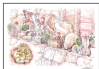
No.86 もみじ谷 蛇塚