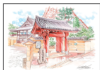
No.83 心光院 表門

浜松町・芝・大門百景に新たに5点のイラストが加わりました。国登録有形文化財の心光院表門、常行院納骨堂、芝東照宮のイチョウと金蓮のパワースポットであるもみじ谷公園、2025年9月にオープンしたコニカミノルタタワー本館が入居するBLUE FRONT SHIBAURAエリアの景色をイラストにしました。