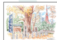
No.85 芝東照宮とイチョウ