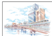
No.87 BLUE FRONT SHIBAURA エリア